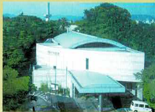
Musée du mémorial de la paix de la ville de Himeji