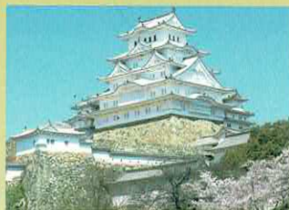
Château de Himeji, patrimoine mondial de l'UNESCO, qui a échappé miraculeusement aux bombardements aériens